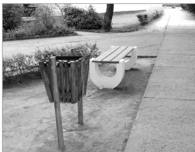
Pad és hulladéktároló