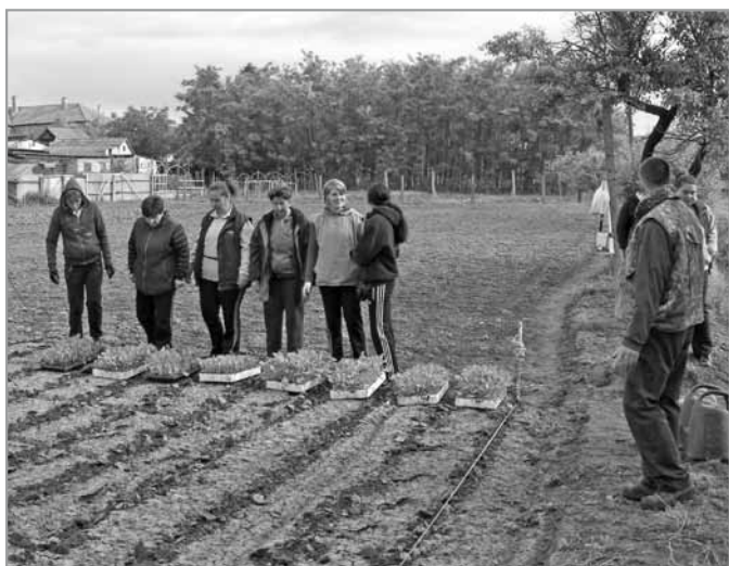
Elkészülni, vigyázz, kész, rajt!

Eltelt több mint egy év és lehetőségünk nyílt a program folytatására, úgynevezett ráépülő program keretében. Terveket kellett készítenünk az előző év tapasztalatai alapján a mezőgazdaság, a térkögyártás és a zöldterületi ágazatmunka hatékonyságának növelésére, a jó minőségű zöldségfélék és termékek előállítására . Az egyes ágazatokban bővítettük a létszámot, és így több ember jutott helyben munkához. Községünk vezetői fontosnak tartják, hogy egyfajta iránymutatással segítsenek a rászoruló családoknak, hisz ebben a régióban nagyon nehéz munkát találni. Az értékteremtésen van a fő hangsúly. A mezőgazdaságban megtermelt zöldségfélék a konyhán kerülnek felhasználásra. A térkövek szebbé teszik környezetünket. A zöldterületen dolgozók a közterületek és vízelvezető árkok tisztításával járulnak hozzá Nagybaracska szebbé, élhetővé tételéhez. Látható, hogy mennyi érték van az emberek kezében. A lakossági visszajelzé-