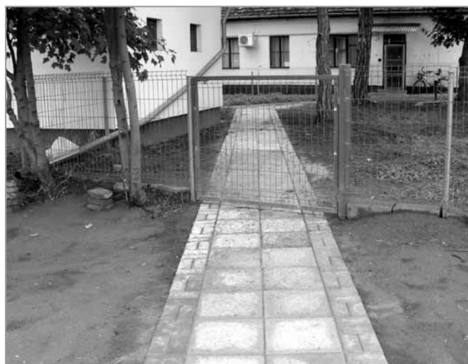
Elkészült a járda

sekből is az derül ki, hogy a fejlődés jó irányba halad. Szépek lettek a padjaink és hulladéktárolóink. Virágos lá-