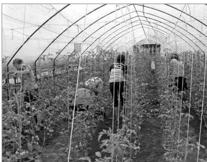
Munka a fóliasátorban

Eltelt több mint egy év és lehetőségünk nyílt a program folytatására, úgynevezett ráépülő program keretében. Terveket kellett készítenünk az előző év tapasztalatai alapján a mezőgazdaság, a térkögyártás és a zöldterületi ágazatmunka hatékonyságának növelésére, a jó minőségű zöldségfélék és termékek előállítására . Az egyes ágazatokban bővítettük a létszámot, és így több ember jutott helyben munkához. Községünk vezetői fontosnak tartják, hogy egyfajta iránymutatással segítsenek a rászoruló családoknak, hisz ebben a régióban nagyon nehéz munkát találni. Az értékteremtésen van a fő hangsúly. A mezőgazdaságban megtermelt zöldségfélék a konyhán kerülnek felhasználásra. A térkövek szebbé teszik környezetünket. A zöldterületen dolgozók a közterületek és vízelvezető árkok tisztításával járulnak hozzá Nagybaracska szebbé, élhetővé tételéhez. Látható, hogy mennyi érték van az emberek kezében. A lakossági visszajelzé-