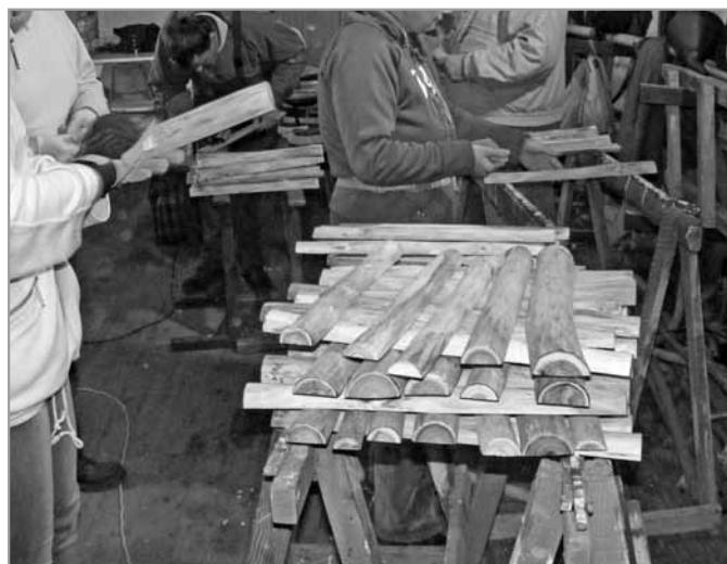
A szorgos kezek (utcai szemeteskészítés)

sekből is az derül ki, hogy a fejlődés jó irányba halad. Szépek lettek a padjaink és hulladéktárolóink. Virágos lá-